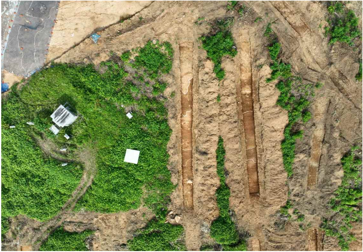
[사진 3] 구상유구(남향사면부) 노출 전경(Tr.85~86)