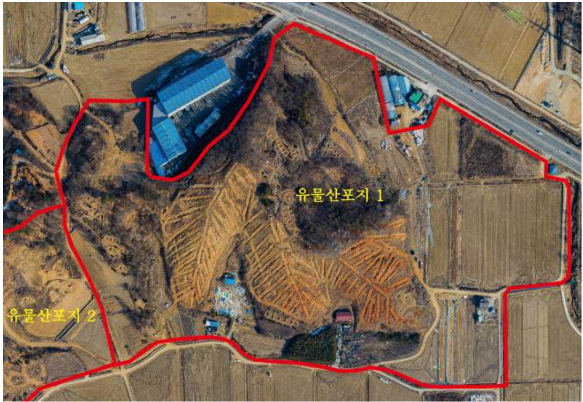
[사진 1] 1차 시굴조사 후 전경(유물산포지 1)