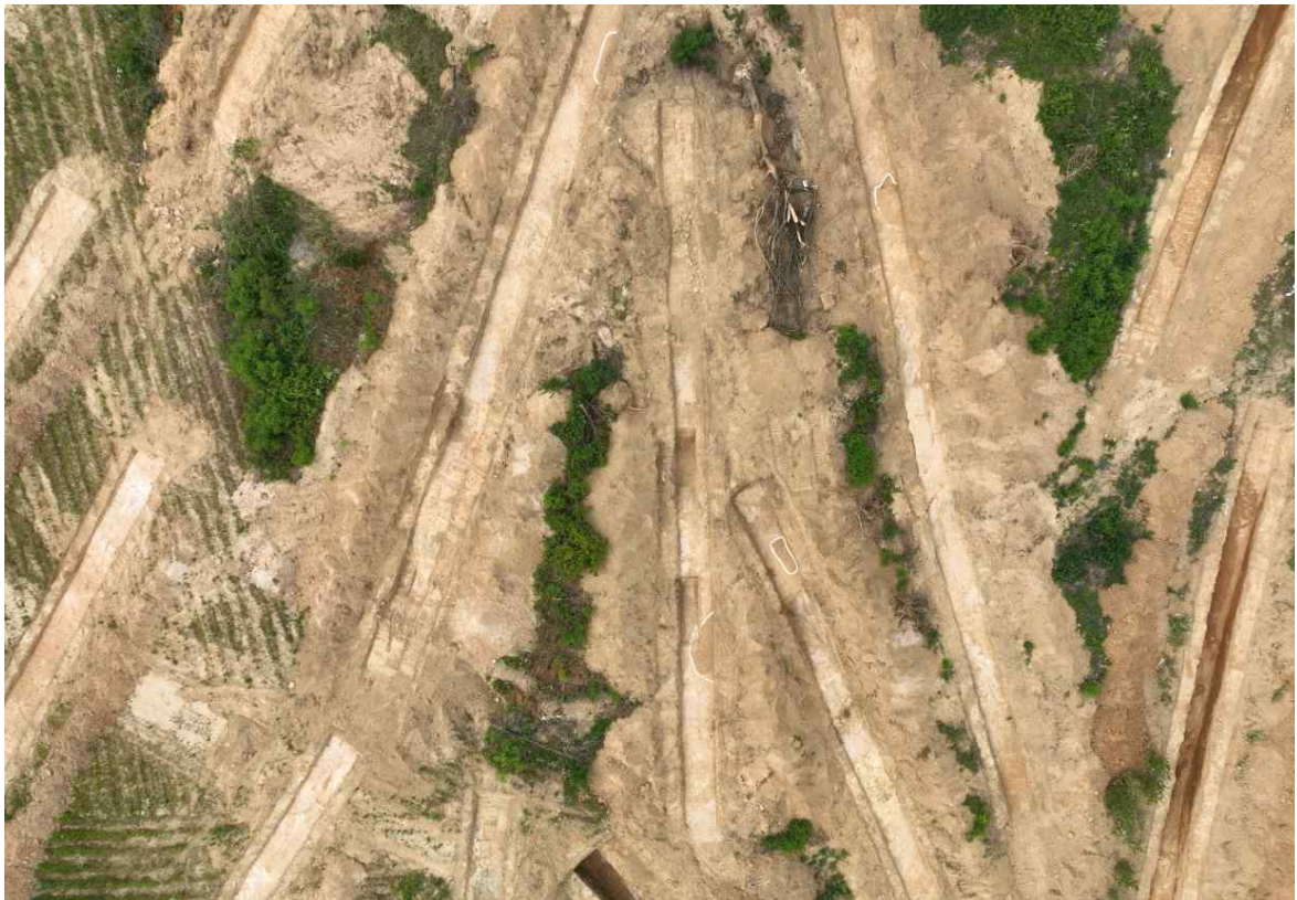
[사진 4] 수혈주거지 · 토광묘 노출 전경(Tr.209 · 214~216)