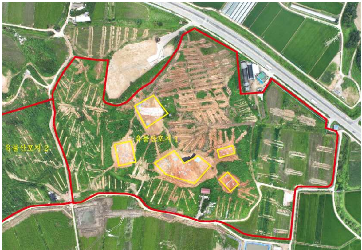
[사진 2] 3차 시굴조사 후 전경(유물산포지 1)